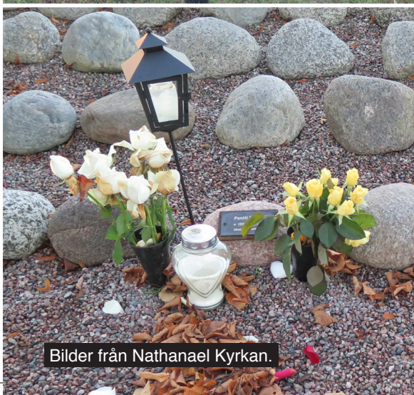
Bilder från Nathanael Kyrkan.